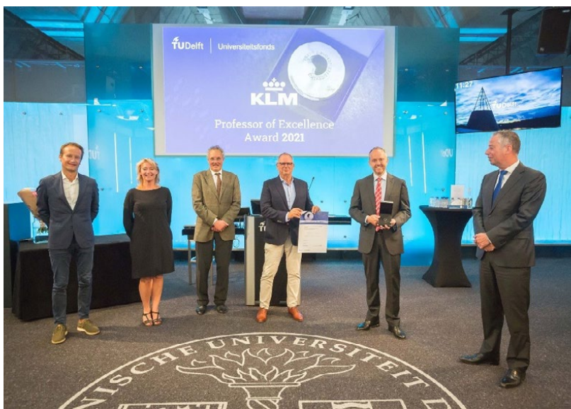
Voorbeeld uitreiking jaar-award voor beste hoogleraar i.s.m. KLM