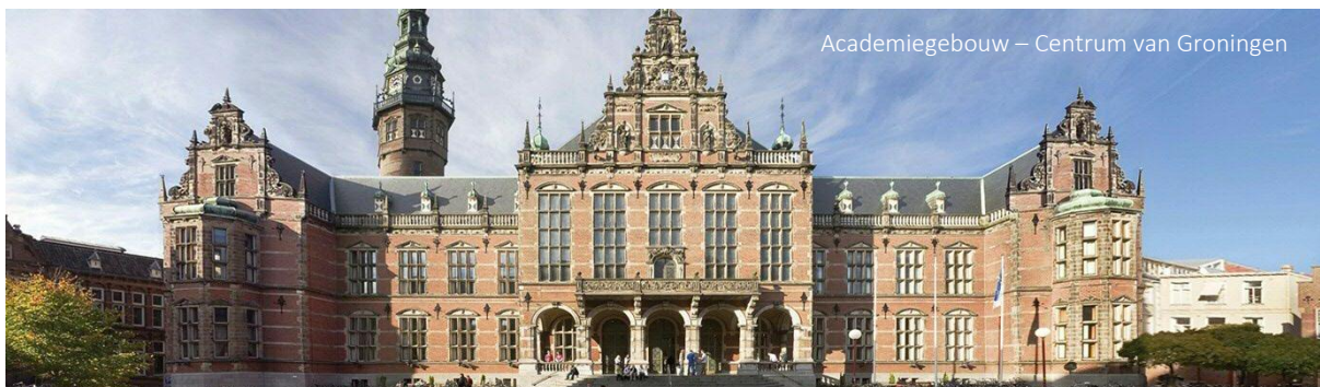
Academiegebouw – Centrum van Groningen

Voor onze opdrachtgever de Rijksuniversiteit Groningen ( RUG ) zijn we voor haar Centrum voor Informatie Technologie ( CIT ) op zoek naar een stevige, vakkundige, verbindende en inspirerende Directeur CIT (tevens CIO ), die nader vorm geeft aan de digitale agenda van de RUG. Als Directeur CIT zorgt u voor operational excellence , zoekt u de verbinding door de gehele universiteit en loopt u voorop bij nieuwe technologische ontwikkelingen op het gebied van onderwijs en onderzoek. U heeft enerzijds een interne focus op de vraagarticulatie vanuit de universiteit (het primaire proces) en bent anderzijds gericht om op landelijk en internationaal niveau te participeren en daarbij de juiste innovaties mee terug te nemen naar Groningen. Als CIO zet u de IT-koers/strategie uit in lijn met de visie en strategie van de RUG en neemt u als boegbeeld uw mensen binnen CIT in het juiste tempo hierin mee. U floreert in een groeiende, dynamische en complexe omgeving met een hart voor onderzoek, onderwijs, mensen en de samenleving (van nu en van de toekomst). De Directeur CIT draagt zorg voor een toekomstbestendige positionering van CIT binnen dit complexe en continu ontwikkelend speelveld. U gaat vanuit uw expertise bijdragen aan de relevante missie van de breedste en één van de oudste universiteiten van Nederland.