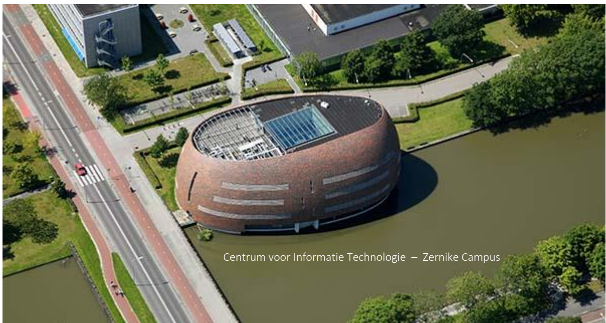
Centrum voor Informatie Technologie – Zernike Campus